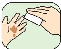
手指の 汚れ落としに