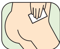
局部または 肛門部のふきとりに